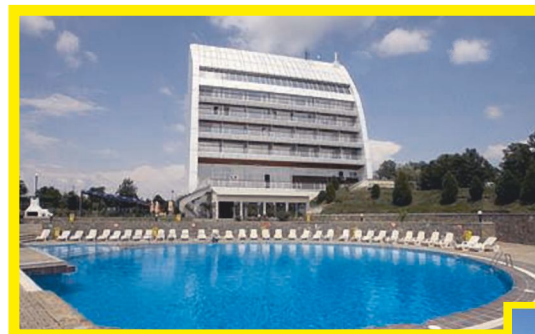
Complex Olimpic Izvorani